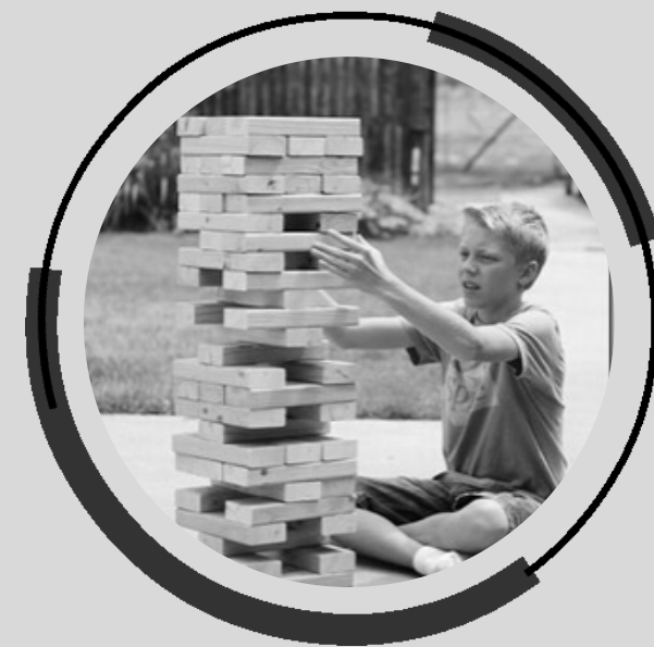
Palju loodushariduslikke tegevusi noortele