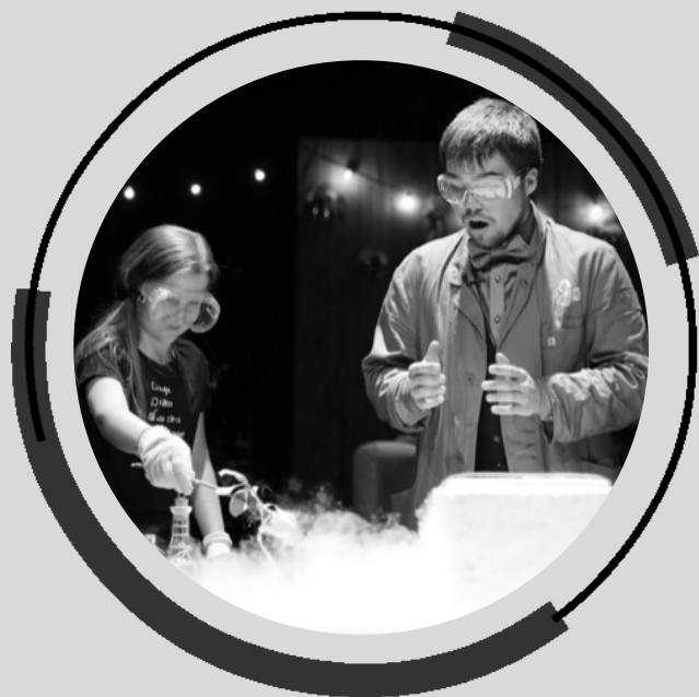
Uuringu II osa